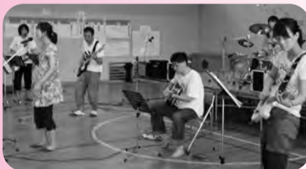
▲27日～29日廃校になった月出小学校を活用し、楽器未経験者あるいは、中途であきらめてしまった方を対象に3日間の合宿を行った。

市津春まつり 汚染負荷量賦課金説明会 姉崎青年部総会 新入社員セミナー 市原青年部総会 五井青年部総会