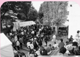
▲21日市内の自慢の逸品が出揃った「食」のフェスティバル

第22回臨時議員総会 五井青年部視察研修 加茂支部視察研修 市津商店会菊まつり サッカー観戦会 簿記検定試験 「食」のフェスティバル 優良従業員表彰式 福祉住環境コーディネーター検定試験 広域ビジネス交流会 姉崎菊祭り感謝祭