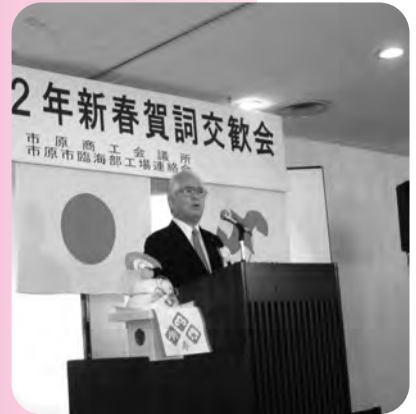
▲8日、市原市民会館にて新春賀詞交歓会を開催、新年の抱負を語る。

新春賀詞交歓会 サービス部会視察研修 J-SaaS説明会 経営再建セミナー 「あねぼん」祝賀会