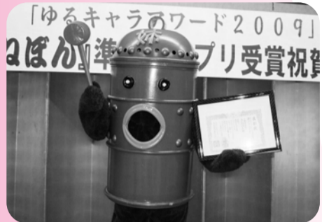
▲21日、「あねぼん祝賀会」ゆるキャラアワード2009準グランプリ