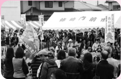
▲24日、姉崎門市、門前市の「ゆるキャラアワード」が会場を沸かす。

新事業展開セミナー 販売士検定試験 3号議員選考委員会 第197回常議員会 建設部会視察研修 珠算検定試験 姉崎門市 八幡宿祭 若手社員パワーアップ研修