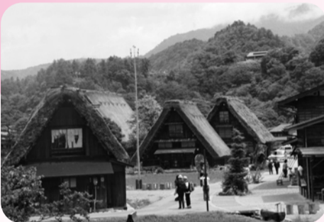
▲20日、21日 第19回会員研修 長野県松本市の城下町や世界遺産白川郷を視察

経営革新認定事業所懇談会 五井臨海祭り 市津支部視察研修 簿記検定試験 物産協議会総会 市原青年部視察研修 市原支部総会 珠算検定 市津支部総会 中小企業応援センター連絡会議 観光部会 市内高校進路担当教員懇談会 会員研修