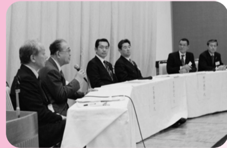
▲17日、中小企業連携フォーラム市原・茂原・木更津・君津・館山の商工会議所で共催、パネルディスカッションにて経営革新を発表