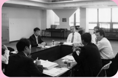
▲2日、経営革新企業による懇談会、今後の事業展開について交流を図る。

第195回常議員会 姉崎産業祭 建設部会セミナー 八幡臨海祭り 女性会総会 経営セミナー 第77回通常議員総会