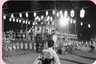
▲22日、市津夏祭り 地域商店会の事業PRや住民への思い出のあるふるさとづくりを目指す。