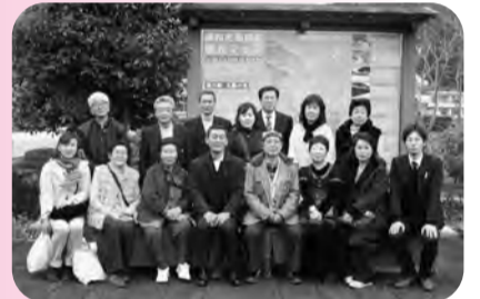
▲17日、18日、市原市物産協議会視察研修 焼津・富士宮市

珠算検定試験 確定申告指導会開始 物産協議会視察研修 経営力向上セミナー 適格年金移行セミナー インターネット事業説明会 簿記検定試験 販売士検定試験 下請代金法セミナー IT経営革新塾