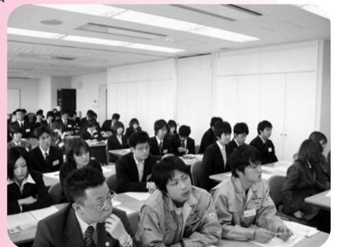
▲27日、新入社員セミナーを開催。社会人としての姿勢やビジネスマナーを学習する。