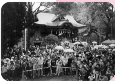
▲24日、八幡宿から地域活性化