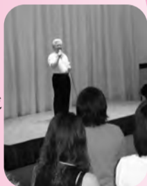
▲25日 カップリングパーティーを五井グランドホテルにて開催。

ビジネス実務法務検定試験 販売士検定 観光部会 ゴルフ場見学会 福祉住環境コーディネーター検定 環境社会検定(eco検定)試験 カップリングパーティー 事業再生セミナー 八幡納涼盆踊り大会 第196回常議員会