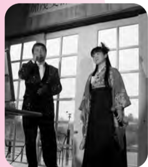
▲6日、加茂城支部カラオケ大会高滝リンクス倶楽部にて20名が自慢の歌を披露

加茂カラオケ大会 第194回常議員会 インターネット事業説明会 中小企業連携フォーラム あねぼんモニュメント除幕式 第76回通常議員総会 売掛債権回収セミナー 第3回夕方セミナー